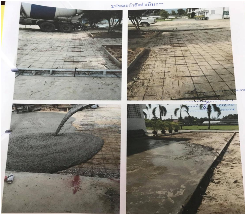
รูปขณะกำลังดำเนินการ