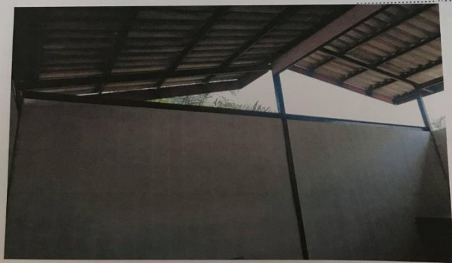
รูปดำเนินการแล้วเสร็จ

..... ประธานกรรมการ ..... กรรมการ ..... กรรมการ ..... กรรมการ ..... กรรมการ