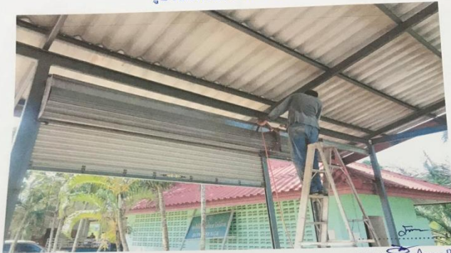
รูปขณะกำลังดำเนินการ

..... ประธานกรรมการ ..... กรรมการ ..... กรรมการ ..... กรรมการ ..... กรรมการ